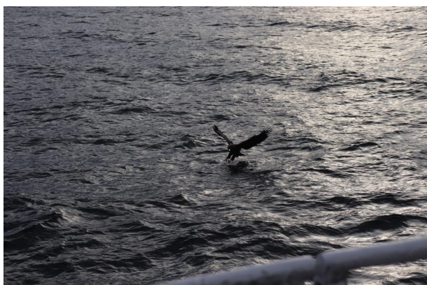
Photo d'un "white tailed eagle" prise durant mon voyage aux îles Lofoten, sur un bateau qui faisait le tour des Fjords

Parc naturel de Pilpasuo où j'y ai passé la journée et fait de la randonnée avec des amies.