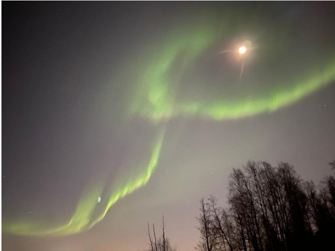
Photo prise lors de ma dernière soirée à Oulu. Les aurores boréales sont très fréquentes, il ne faut pas avoir peur de ne pas en voir. J'ai vu ma première le 2e soir de mon arrivée en août ;)