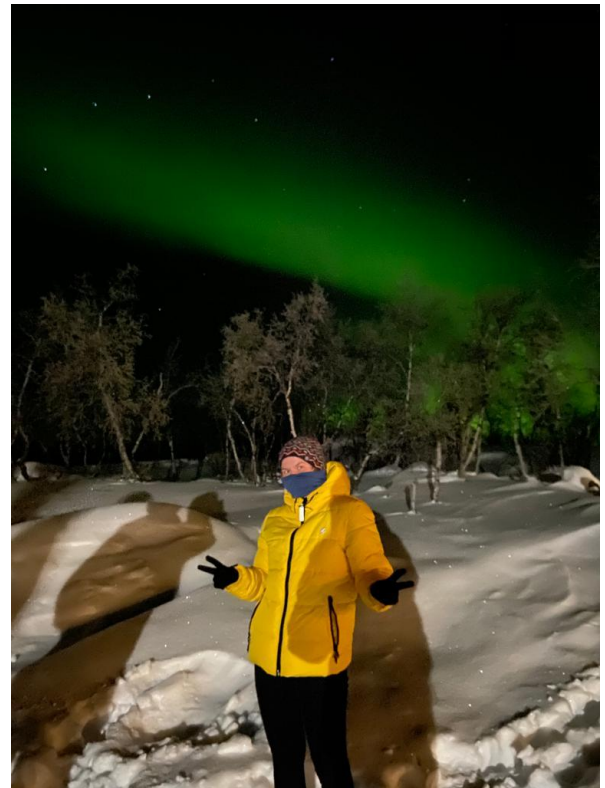
J'ai vu de superbes aurores durant mon voyage en Laponie, dans le Nord de la Finlande, où les températures ont atteint -35^{\circ}\text{C} .